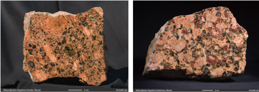
Bild 6 (links): Viel Grundmasse, wenige Feldspäte, darunter eine kantige Verwachsung mehrerer Kristalle (Andör) Bild 7 (rechts): Wenig Grundmasse, Feldspäte um 2-3 cm, rotbrauner Plagioklas (Söderharu)

Hat der Granit nur wenig Grundmasse , dann sind die Feldspäte etwa 2-3 cm groß. Das Gestein wirkt massig (Bild 7) und wurde vor allem im Norden des Plutons auf den Inseln Norderharu und Söderharu gefunden.