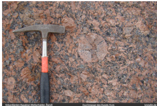
Bild 5: Pyterlitgefüge mit Ovoid, 9 cm Durchmesser (Mellanhalder)

Das Aussehen des Granits hängt entscheidend vom Anteil der Grundmasse ab. Viel Grundmasse mit eher vereinzelt Feldspäten ergibt ein ausgeprägt porphyrisches Gefüge. Dann sind einzelne